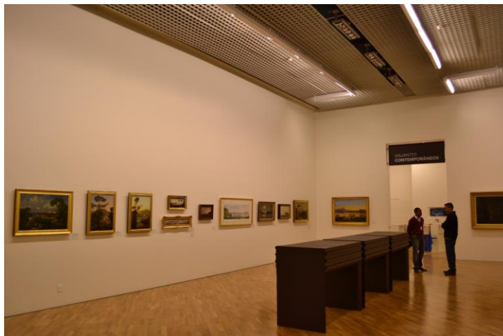
Aspecto de la nueva exposición de los fondos de la Pinacoteca, 2011

El segundo piso de la Pinacoteca Luz se cerró a visitación pública en diciembre de 2010, siendo que un conjunto de cerca de 30 obras se reunió en una de las salas expositivas del primer piso en una muestra intitulada Elementos destacados de los fondos . En los diez meses que se siguieron, se procedió a la remoción de las moquetas e instalación de un nuevo pavimento, lo que ofreció no solo un mejor acabado y apariencia de las salas, sino, también y principalmente, una mejora en las condiciones acústicas en el interior de las galerías y del propio museo. Se construyeron nuevas paredes/paneles al efecto de ampliar la extensión lineal para presentación de trabajos y acentuar el carácter de galería de las salas, que ganaron también un nuevo proyecto de iluminación. Por otra parte, el Núcleo de Conservación y Restauración trabajó intensamente en la limpieza y consolidación de todas las obras que integrarían la exposición.